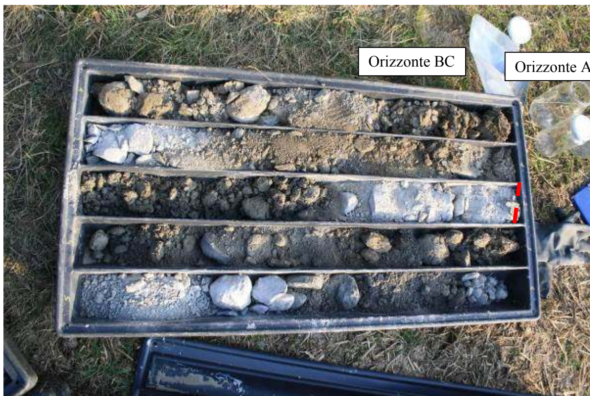
Orizzonti PEDO 05_Eliporto