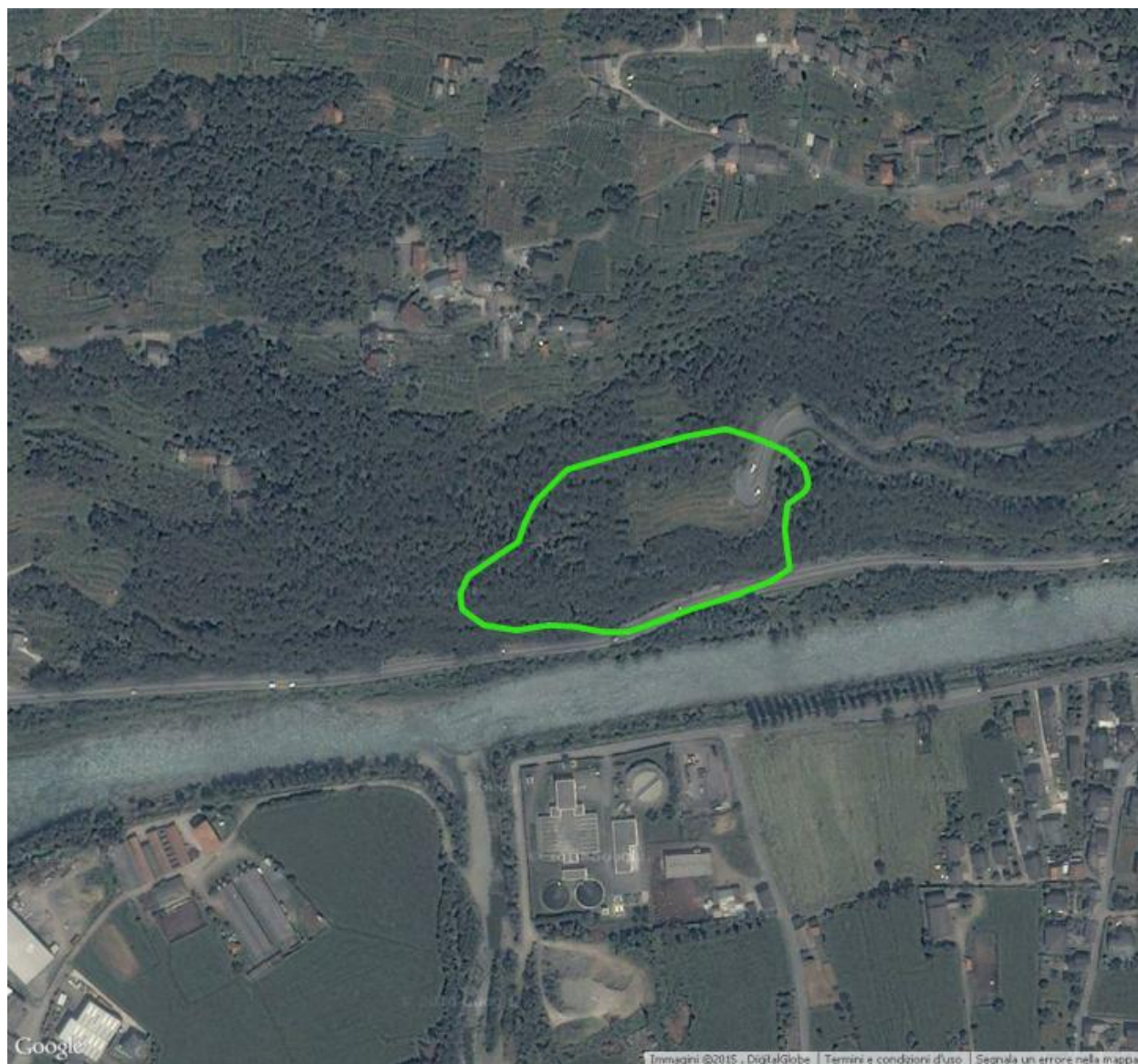
Area di rilevamento Vege01