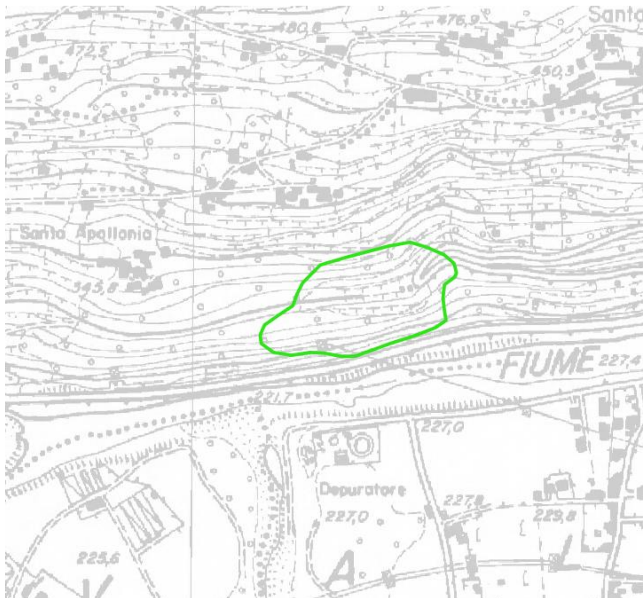
Area di rilevamento Vege01