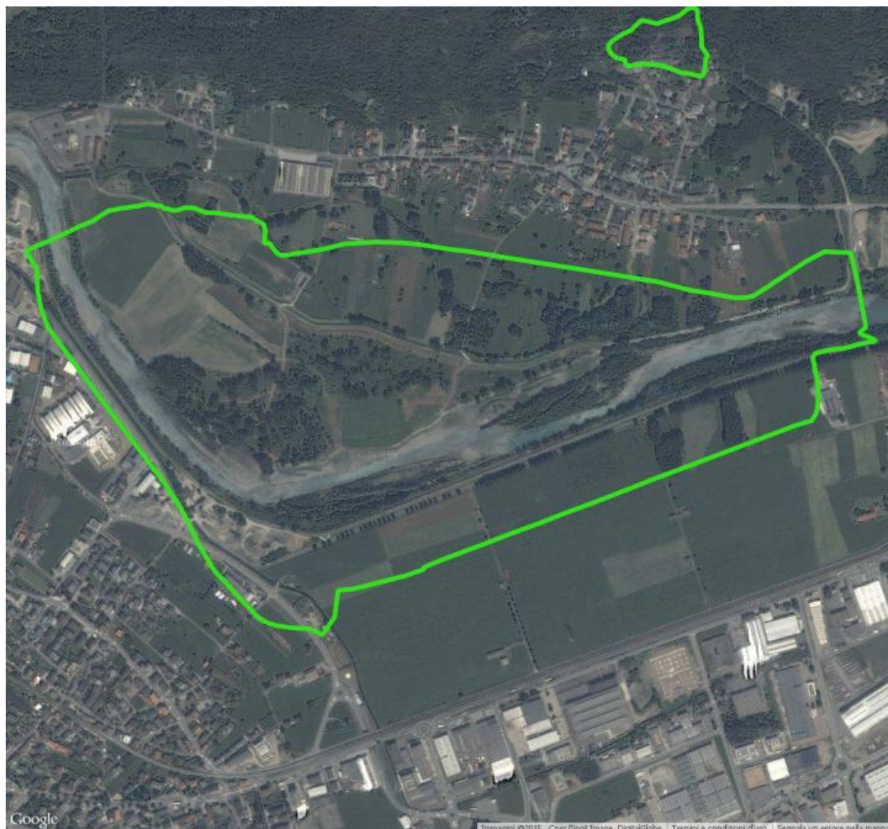
Area di rilevamento Vege05